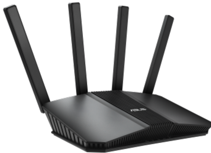
Routeur Wifi Asus RT BE58U

Le protocole de routage interne EIGRP (Enhanced Interior Gateway Routing Protocol) , principalement utilisé par les routeurs Cisco