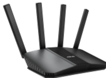
Routeur Wifi Asus RT BE58U

Le protocole de routage interne EIGRP (Enhanced Interior Gateway Routing Protocol) , principalement utilisé par les routeurs Cisco