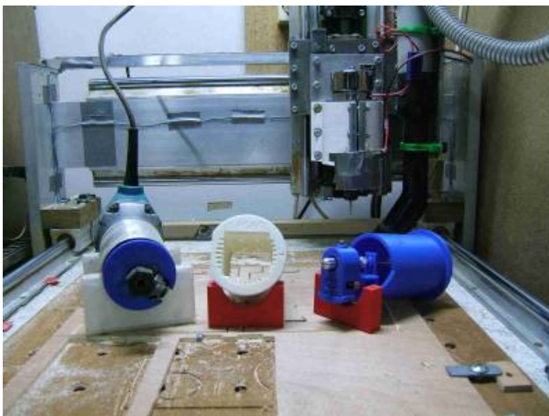
-3- détail de l'axe X