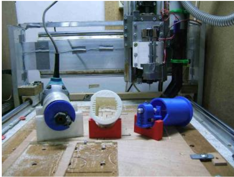
-3- détail de l'axe X