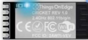
IOT Cricket Wi-Fi module

Vous pouvez maintenant commencer à configurer Cricket (voir la section CONFIG ) et le configurer pour envoyer des données aux appareils clients : smartphone, ordinateur portable, PC, ... Pour en savoir plus sur la façon de recevoir des données de Cricket sur les appareils clients, rendez-vous dans la section API de communication .