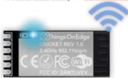
IOT Cricket Wi-Fi module