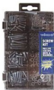
○ Vis (exemple...)