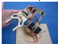
○ les pièces en 3D