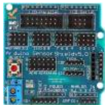
◦ Sensor shield V5