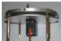
○ la base