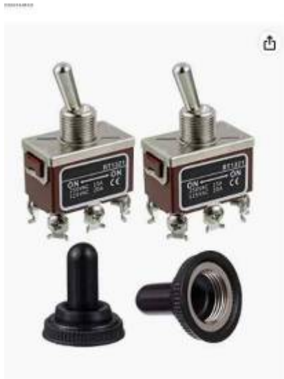
Passez la souris sur l'image pour zoomer