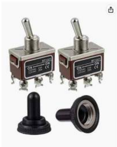
Passez la souris sur l'image pour zoomer